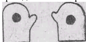
Рис. 1. Тренажер «Солнышко»

Для изготовления тренажера нужен материал темного цвета, из которого шьются две рукавички. Из желтой, красной или оранжевой материи вырезаются два кружка размером 4-5 см. Они нашиваются в центр ладонной поверхности рукавичек снаружи.